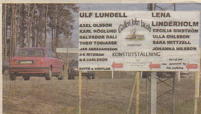
Skyften spelade huvudrollen för Galleri John Jacob vid Järrestad. Mängder av besökare gjorde spontana avstickare när de såg Ulf Lundells namn.

Att döma av de ganska få röda prickarna var det inte precis högtryck på försäljning av konstverken.